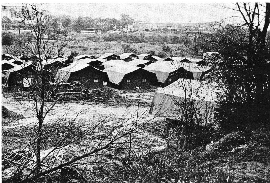
Camp d'accueil de la Croix-Rouge portugaise pour les réfugiés d'Angola.

Souvenez-vous... Les rapatriés venant d'Angola, du Mozambique et de Timor commencèrent à affluer au Portugal, en nombre sans cesse croissant au milieu de 1975. Depuis bientôt deux ans, la Croix-Rouge portugaise, aidée par de nombreuses Sociétés sœurs, leur prodigue son assistance. Durant la première phase de cette opération de secours, alors que l'on ne pouvait pas encore connaître l'ampleur des rapatriements, la Société, avec l'appui des services gouvernementaux compétents, de l'Institut national pour les rapatriés (IARN) et du CICR, a lancé à l'intérieur du Portugal, un appel sollicitant des dons pour couvrir les besoins des rapatriés arrivant chaque jour. Activement occupé à accomplir ses tâches traditionnelles dans