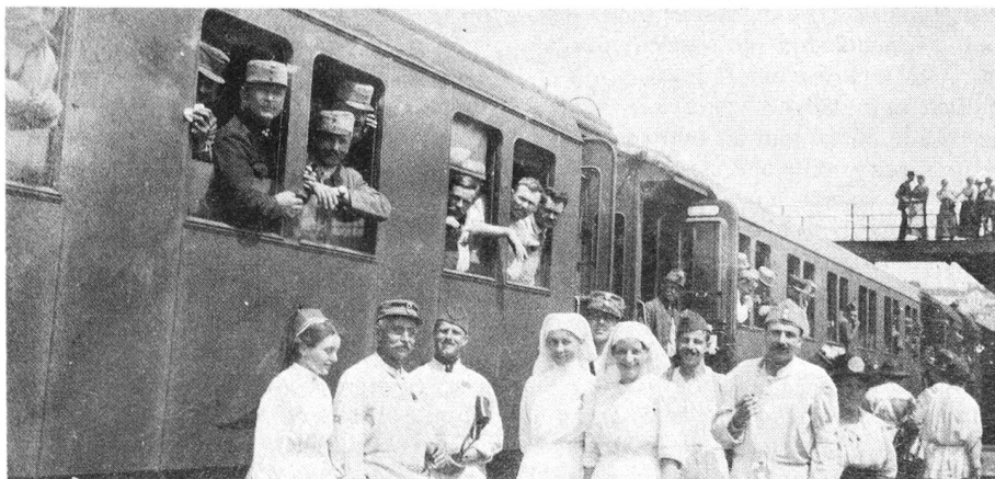
Passage du train en gare de Zurich.