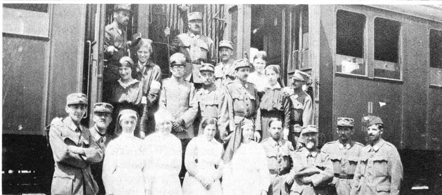
Personnel sanitaire du train Lyon-Feldkirch.