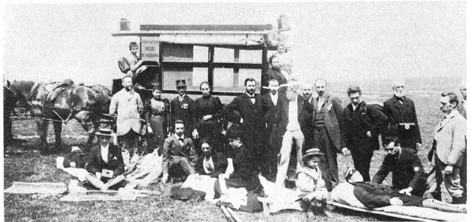
La Belle Epoque. Ambulance de réanimation: il fallait débarquer pour réanimer!