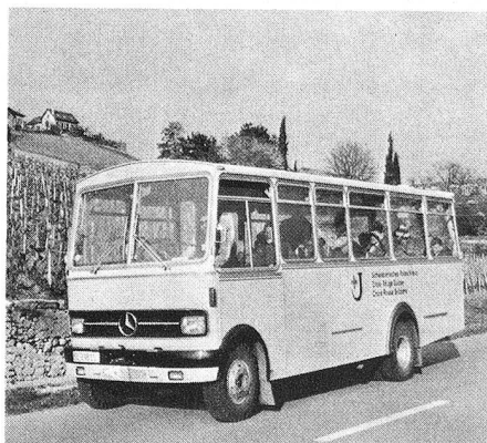
Sur la route de la Côte, vers de nouveaux horizons...