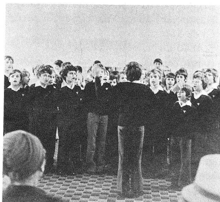
Ce jour-là, les Petits chanteurs à la croix de bois font partie de la fête. Instant émouvant: ils interprètent le «Chant des adieux».