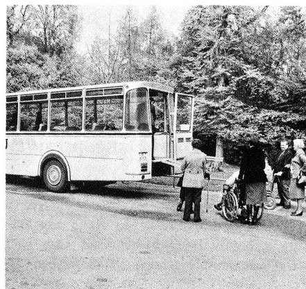
Offerts par les écoliers de notre pays à la Croix-Rouge suisse, les cars continuent leur œuvre humanitaire grâce à votre aide. Merci.