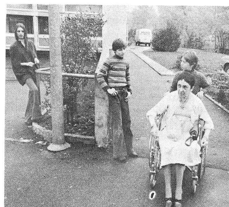
Les jeunes aussi peuvent aider. «Puisque je suis là, je pourrais bien conduire cette dame vers le car.»