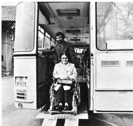
«On est arrivé? Déjà? Dommage! Mais quelle merveilleuse journée...»