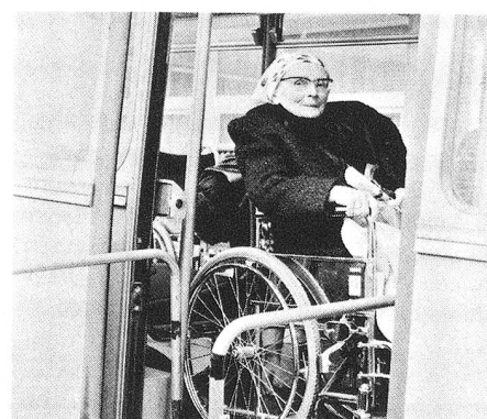
Le sourire timide d'une grand-maman juste avant le départ.