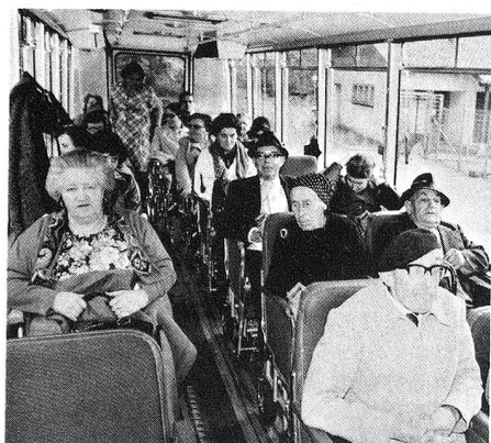
Le grand car peut emmener 23 passagers. Tout le monde est là. En route!