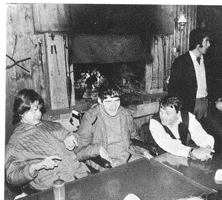
Au milieu du voyage, une petite collation est bienvenue.