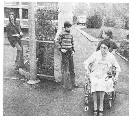
Les jeunes aussi peuvent aider. «Puisque je suis là, je pourrais bien conduire cette dame vers le car.»