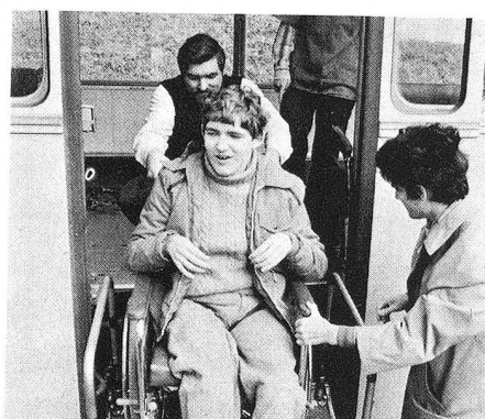
Heureusement qu'il y a un ascenseur pour hisser à bord les chaises roulantes.