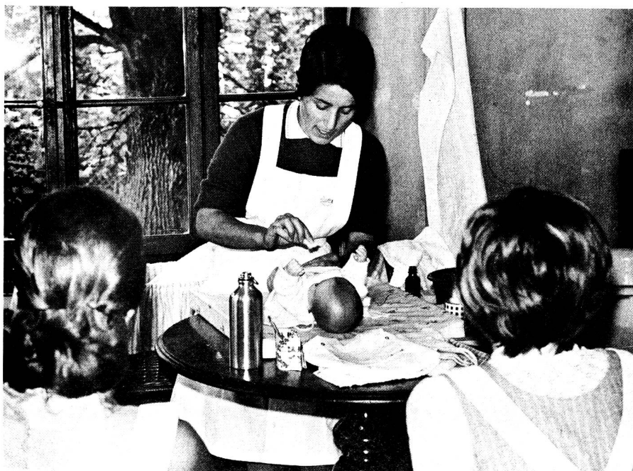
A la ville comme à la campagne le cours de «Soins à la mère et à l'enfant» suscite toujours beaucoup d'intérêt chez les participantes et ... les participants. Nombreux sont en effet les futurs pères qui désirent savoir eux aussi comment soigner bébé!