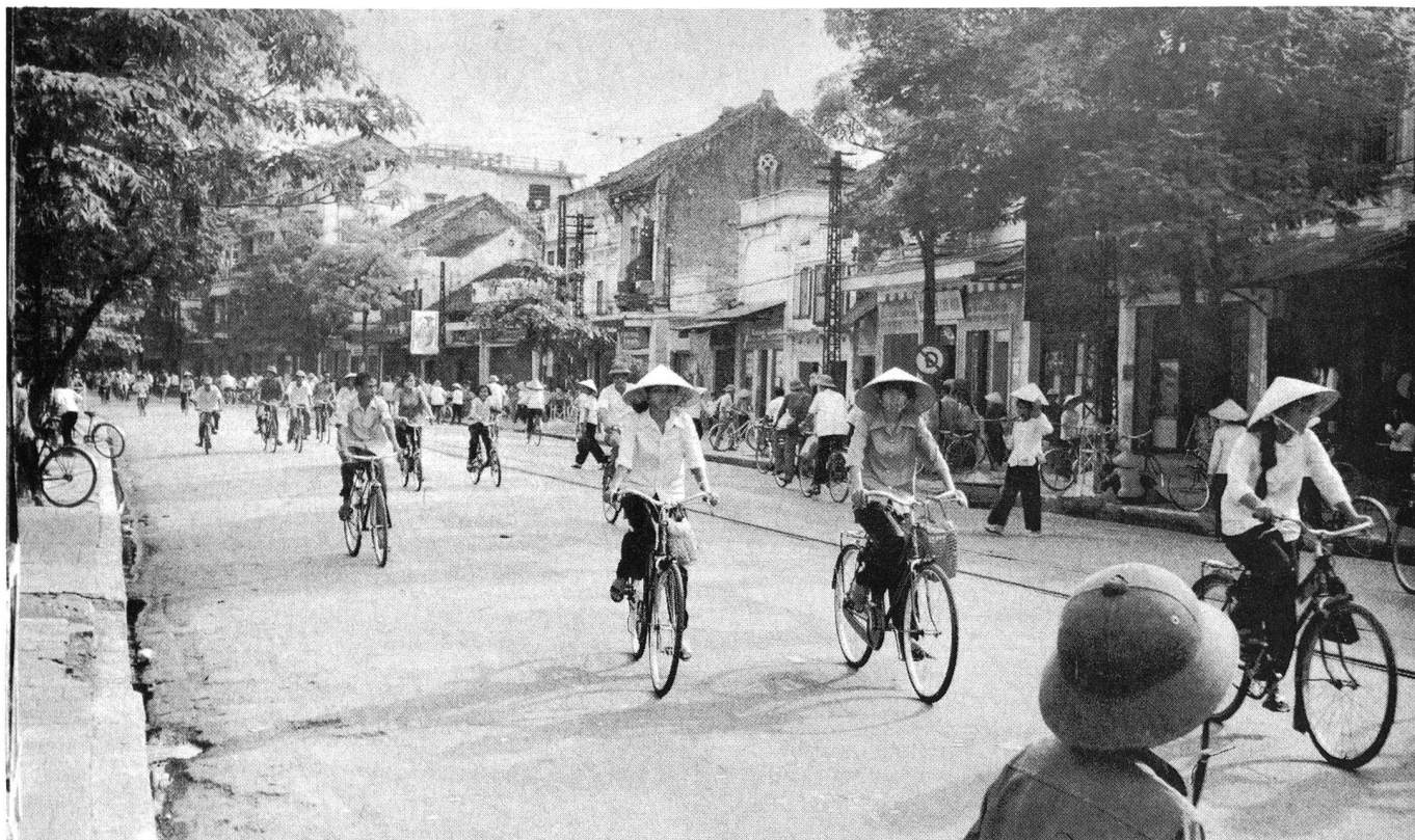
Vue générale de Hanoï dans un ancien quartier français.