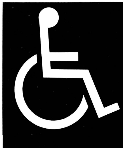
Insegna ICIA, per contrassegnare gli impianti destinati ai menomate

Le abitazioni per anziani, le abitazioni adattabili e le abitazioni speciali per invalidi devono essere ripartite nell'insieme di tutti gli alloggi, onde evitare l'inconveniente dell'isolamento.