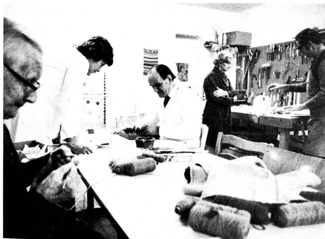
Notre photo: patients du centre d'ergothérapie de Lugano.

Du 1er au 10 mai, la section de Schaffhouse s'est présentée au public dans le cadre d'une campagne «Portes ouvertes» qui s'est tenue dans deux salles du nouvel hôpital cantonal de la ville, obligeamment prêtées pour la circonstance. Le but de cette exposition qui présentait les divers secteurs d'activités de la section: susciter l'intérêt de la population et recruter de nouveaux adhérents. Ouverte tous les jours de 10 à 18 heures, voire 20 heures, l'exposition a attiré 35 000 visiteurs environ, dont 1920 se sont inscrits dans le «Livre d'Or» de la section: autant de membres cotisants ou de collaborateurs bénévoles en puissance?