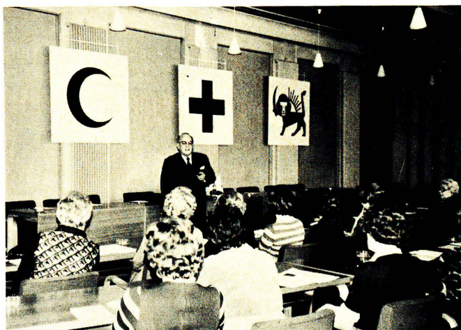
Ci-dessus, le siège de la Ligue des Sociétés de la Croix-Rouge, à Genève.

Cette année, elles se sont déroulées les 25 et 27 mars à Bâle et à Fribourg et le 10 avril à Lugano. De telles rencontres, auxquelles participent les collaborateurs du Secrétariat central concernés par les problèmes traités sont des occasions de dialogue appréciées.