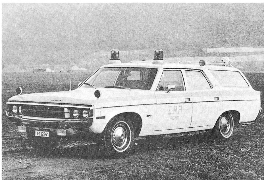
e sotto: dopo le trasformazione