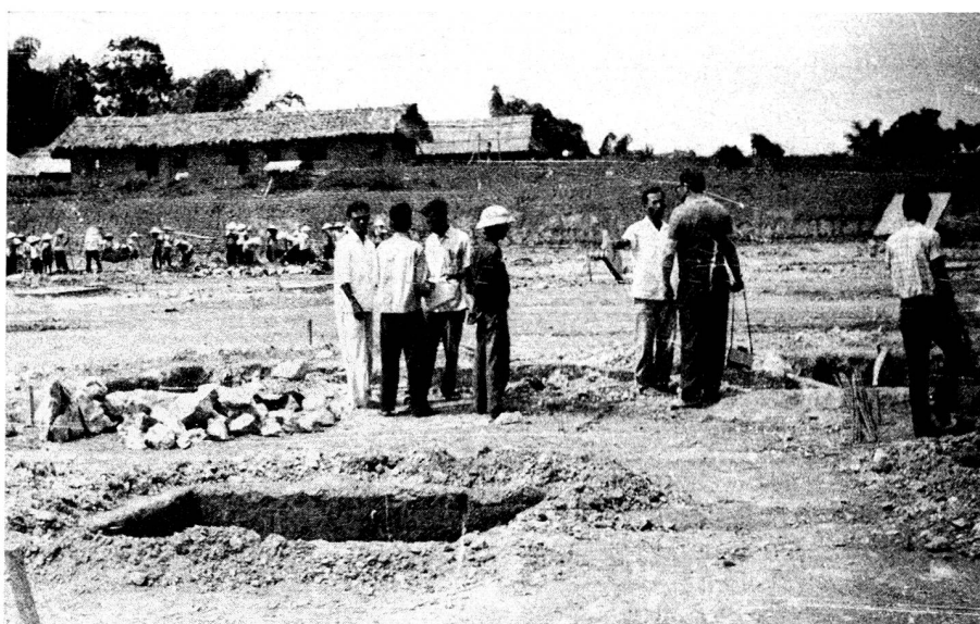
La fabrique de Viet Tri est déjà en chantier. Alors que ses éléments seront fournis par la Suisse, le terrain, les fondations et les voies d'accès sont préparés et mis en place par les Vietnamiens qui exécuteront également les travaux de construction et de montage, selon les instructions des spécialistes suisses. La fabrique commencera de produire au début de 1976.

Or, le projet en voie de réalisation à Viet Tri, au sud de Haïphong, vise précisément à apporter une aide efficace aux familles demeurées sans abri et dont le nombre est estimé à un million à la suite des bombardements ayant précédé le cessez-le-feu de janvier 1973. La région la plus touchée est ce qu'on appelle la «quatrième zone», c'est-à-dire la partie méridionale du pays. C'est ainsi que dans une province, celle de Ninh Binh, tous les villages et toutes les villes ont été détruits, qu'à Haïphong, un quartier ouvrier de 300 000 habitants a été rasé et qu'à Hanoï, toute la rue Kam Thien a subi le même sort.