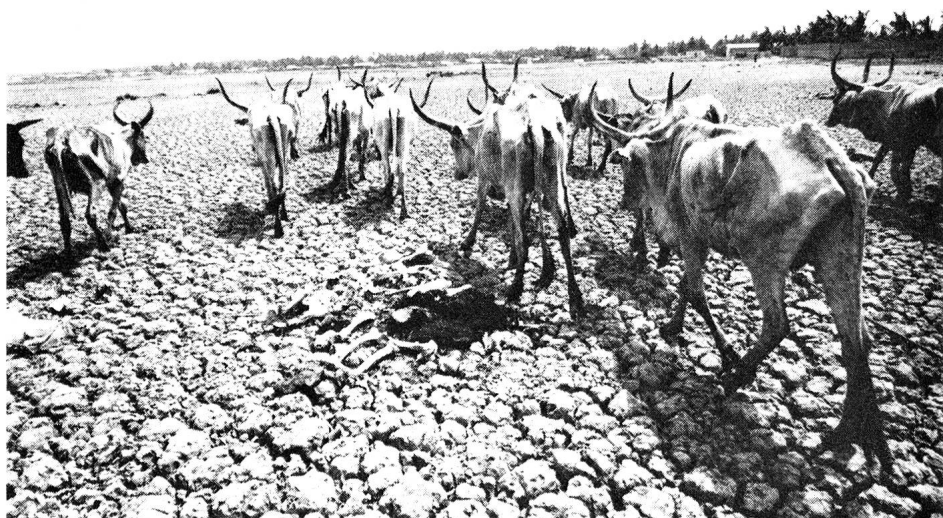
Reste d'un troupeau errant dans un site où il avait coutume de venir se désaltérer: le lac Saint-Louis, au Sénégal.

Ayant reçu par l'intermédiaire du CICR une liste des besoins du Bouclier rouge de David (l'organisation de Croix-Rouge israélienne), la Croix-Rouge suisse a pu consacrer le solde des dons (environ 25 000 francs) récoltés en faveur de ce pays pendant la Guerre d'octobre à l'achat