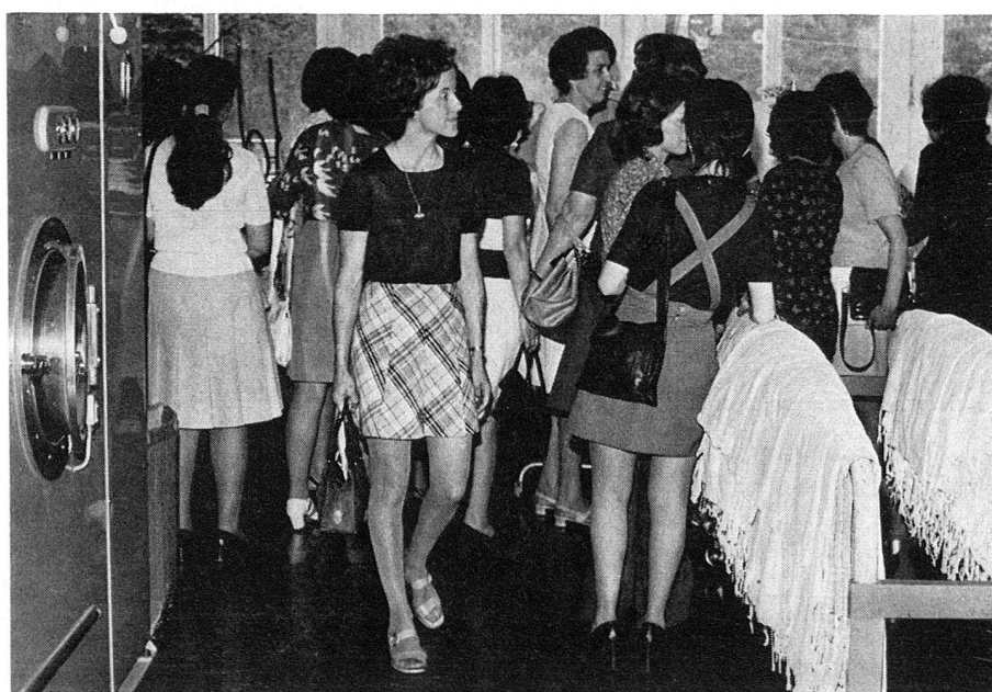
A la Centrale du matériel de la CRS à Wabern, les monitrices tessinoises découvrent les installations modernes de blanchisserie.

Les assortiments fournis pour le cours de «Soins à la mère et à l'enfant», quant à eux, ne comportent que deux caisses chacun; l'an dernier, la Centrale du matériel a procédé à