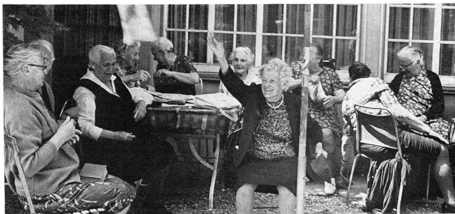
Une bataille de coussins... Oui, mais si ce jeu amuse, il représente aussi un bon exercice corporel!

Bref de quoi faire, en deux semaines, provision de souvenirs ensoleillés qui bientôt peupleront la solitude trop tôt retrouvée.