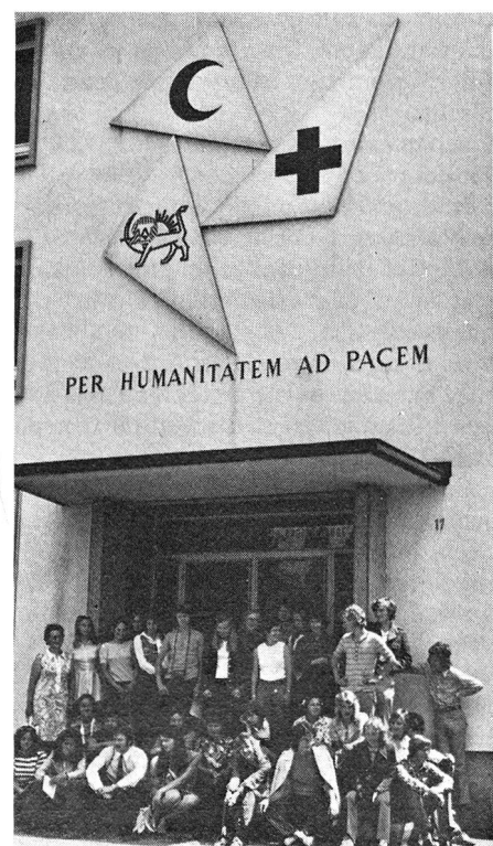
Au programme également: une visite au siège de la Ligue des Sociétés de la Croix-Rouge à Genève.

ces futurs éducateurs avec les principes de la Croix-Rouge, tout en leur inculquant de solides connaissances du secourisme et des soins au foyer.