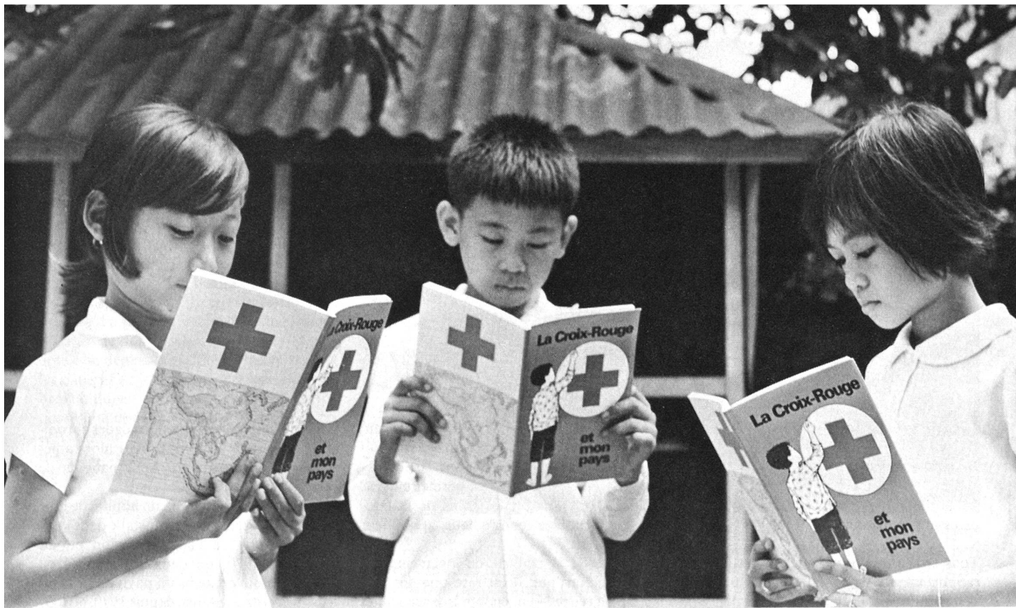
Au Laos, les écoliers lisent le manuel scolaire.