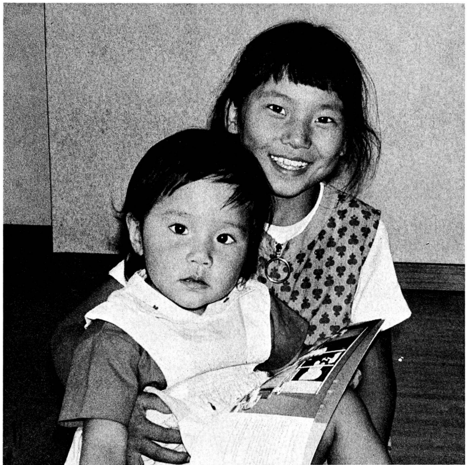
Toutes deux sont nées en Suisse

R.- Tous les Tibétains vivant en Suisse ou dans les pays occidentaux gardent contact avec leurs parents et leurs amis en Inde. Leur présence dans le monde occidental, à mon avis, a largement contribué à faire connaître leur problème dans le monde et à susciter le désir de leur venir en aide. Si tous s'étaient installés uniquement en Inde, le monde les