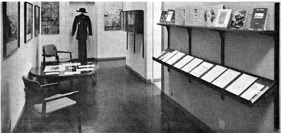
La salle de cours et le hall d'entrée de l'Institut Henry-Dunant.