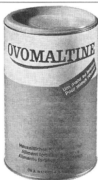
Dr A. Wander S.A. Berne

W. Oertli Ing. SA, 1005 Lausanne, Téléphone 021 - 225517