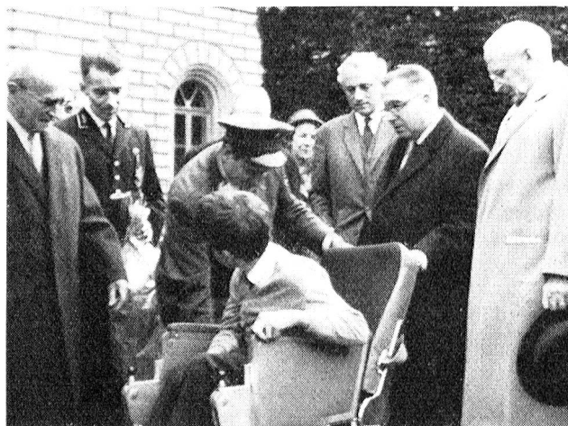
Le 25 novembre 1965, M. le Conseiller fédéral Wahlen, président du Comité de patronage de l'action « Autocar pour handicapés » a visité le car qui stationnait sur la Place du Palais fédéral à Berne et transportait ce jour-là des enfants invalides hospitalisés au home de Rossfeld.

Avant de terminer sa première « saison », le car de l'amitié de la jeunesse suisse s'est rendu encore pour une semaine en Allemagne, sur demande du Comité provincial de la Croix-Rouge de Bade qui avait exprimé le désir de pouvoir essayer les services de ce prototype de véhicule dont tous ceux qui l'ont utilisé d'une manière ou d'une autre se plaisent à souligner le très grand confort, le parfait aménagement et la fort ingénieuse conception.