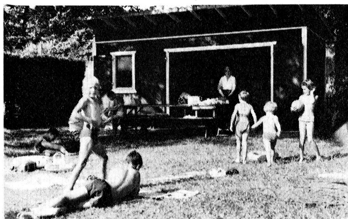
Une coquette baraque, installée par la commune a remplacé le modeste pavillon des débuts.