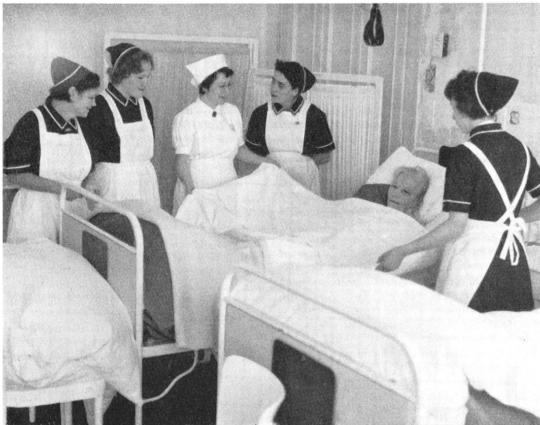
Sept écoles — dont une à Lausanne — forment des aides-soignantes qui rendent de précieux services auprès des malades chroniques ou des vieillards. La formation est de 18 mois et comprend 240 heures d'enseignement théorique.

Notre époque, caractérisée par la pleine occupation, le bien-être général, le nombre croissant des automobiles et l'exiguïté des appartements est une période favorable pour les bien-portants mais souvent plus difficile pour les personnes âgées et impotentes. L'on n'a ni temps ni place pour eux. Certes, des mesures de pré-