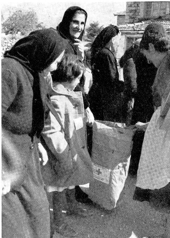
Enfants, mères et grand-mères contemplent le contenu des « merveilleux » sacs venus de Suisse! Leurs cœurs débordent de reconnaissance sincère: « dites bien merci de notre part aux généreux donateurs! »

cipe à la réfection des maisons de familles dont un membre est atteint de tuberculose et dont un ou plusieurs enfants ont séjourné au Préventorium de Microcastro. Cette année, 159 familles bénéficieront de cette forme d'aide si appréciée et qui est apportée dans le cadre de la lutte antituberculeuse menée depuis quelques années avec beaucoup d'intensité, en Grèce septentrionale, par les autorités du pays et la Croix-Rouge hellénique. En outre, notre déléguée a sélectionné 111 enfants et 282 vieillards qui bénéficieront d'un parrainage, les premiers sous forme d'un colis de vêtements et de vivres, les seconds sous forme de la remise périodique de denrées alimentaires ou de petites sommes d'argent.