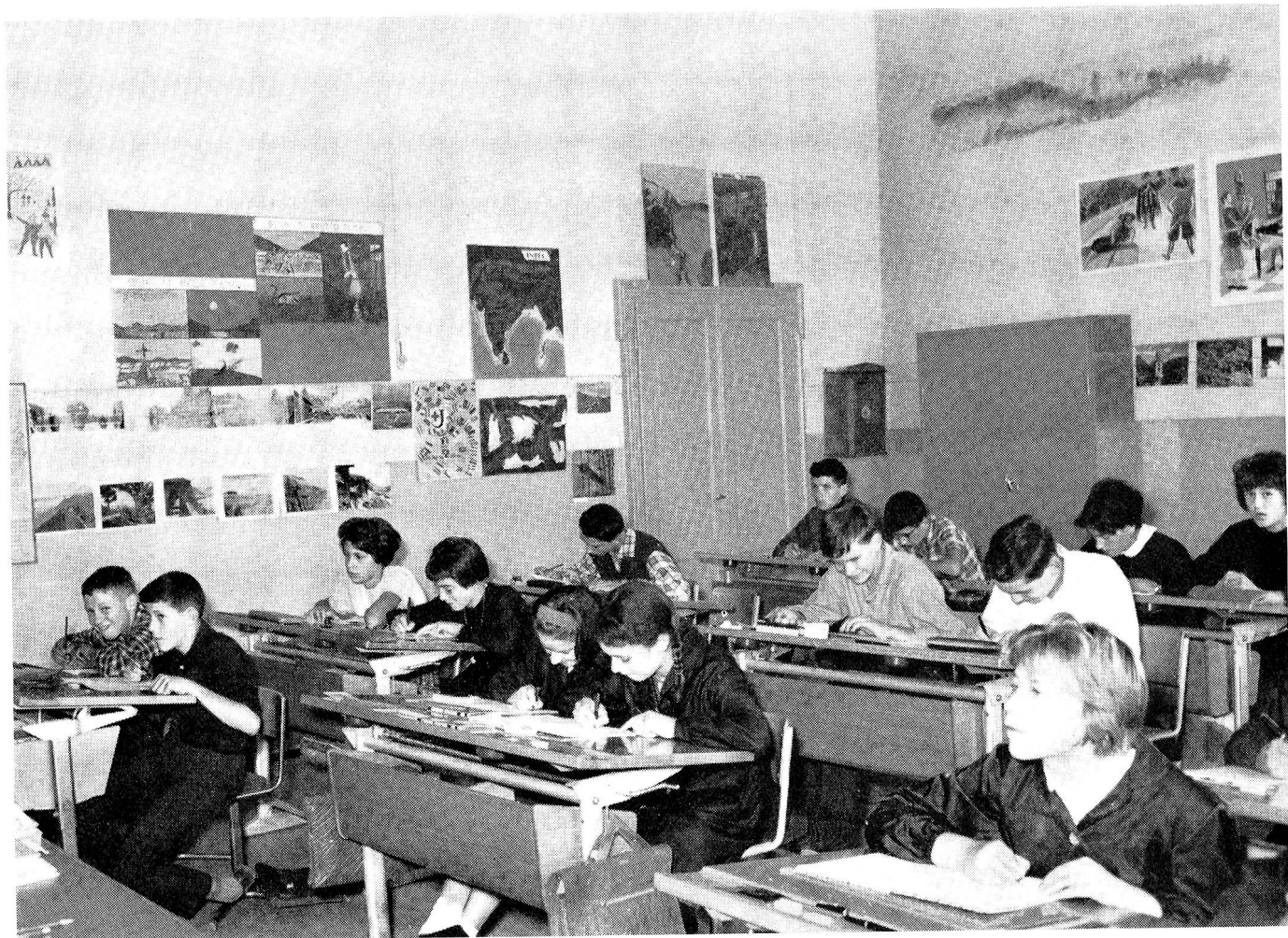
Vacallo: La classe disciplinata e attenta nel primo giorno di scuola