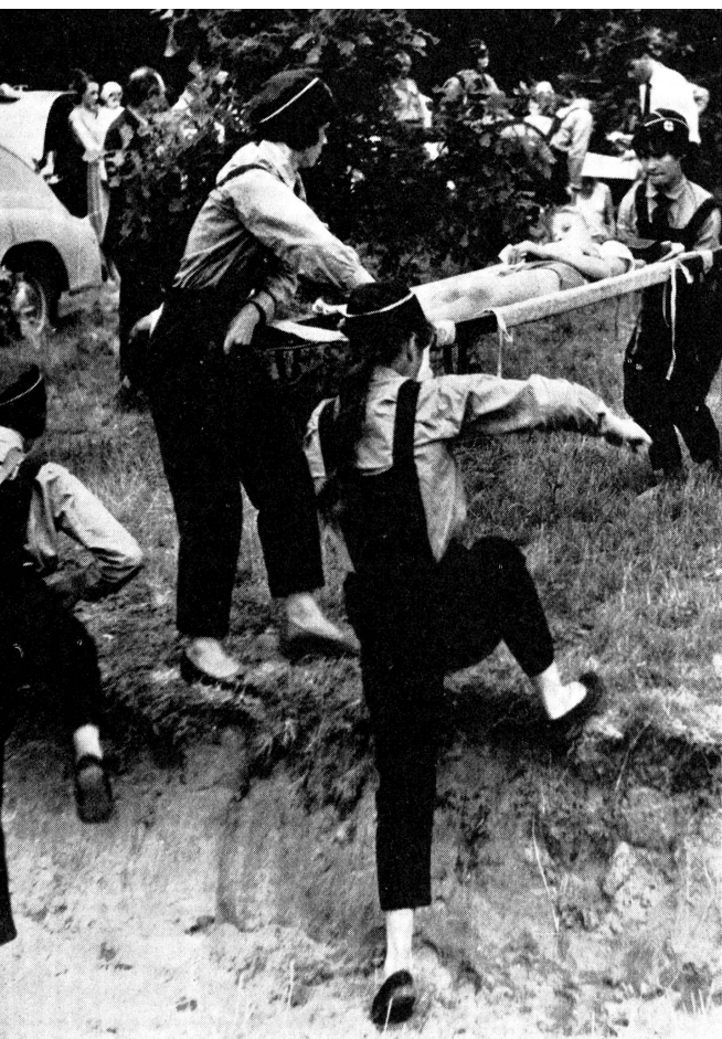
Des juniors polonais exercent les premiers secours