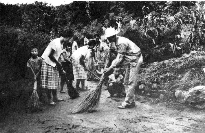
En République de Corée, des juniors balaient les rues de leur village