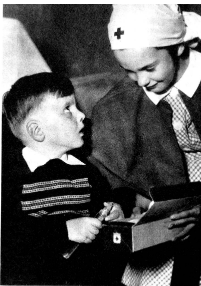
En Australie: Distribution de boîtes-cadeaux de la Croix-Rouge américaine dans un hôpital

DANS LE MONDE ENTIER, JUNIORS D'AUJOURD'HUI PREPARENT LA CROIX-ROUGE DE DEMAIN. ILS SONT MILLIONS (CONTRE 107 MILLIONS DE MEMBRES ADULTES) QUI METTENT ANNUELLEMENT EN PRATIQUE LES TROIS PRINCIPES DE LA CROIX-ROUGE DE LA JEUNESSE: ENTRAIDE - HYGIENE ET SANTE - COMPREHENSION INTERNATIONALE.