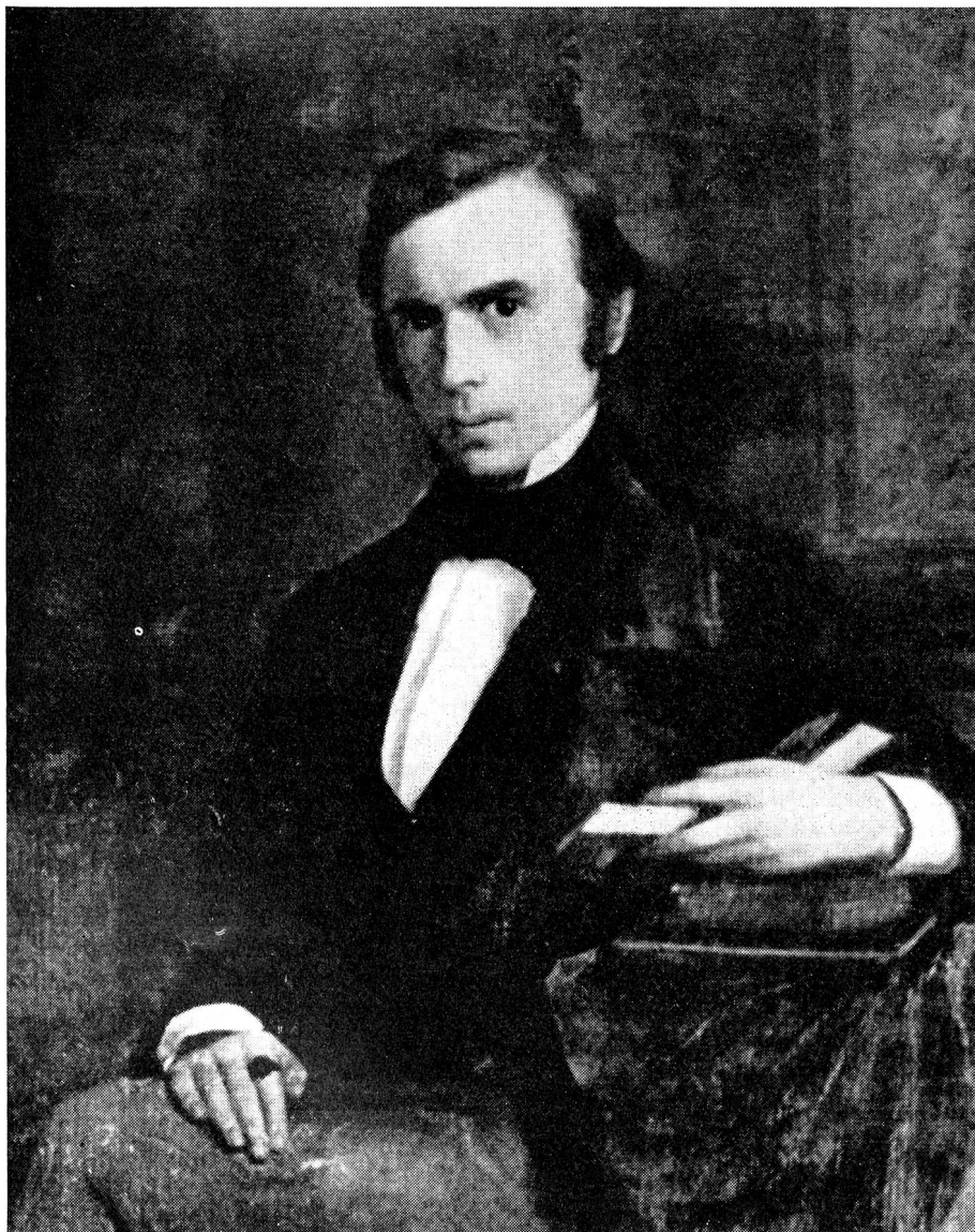
Le docteur Louis-P.-A. Appia (1818-1898) porta le premier le brassard blanc à croix rouge sur un champ de bataille au Sleswig en 1864

Grâce, en grande partie, à l'intervention de Napoléon est réunie, à Genève, la Conférence de 1863. Cette Confé-