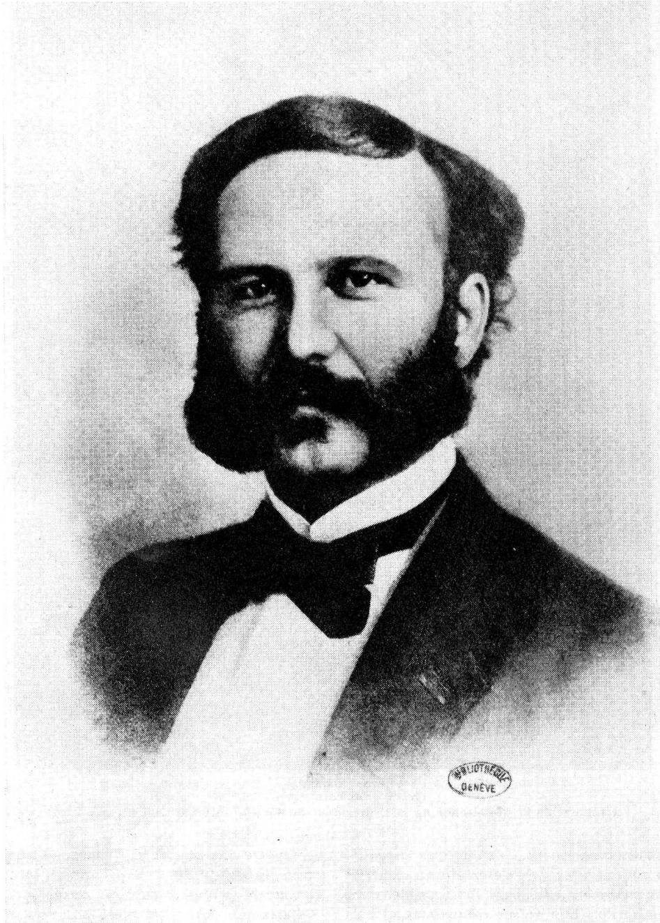
J.-H. Dunant (1828-1910), le semeur d'idées

par toute l'Angleterre. Une admirable femme, Florence Nightingale , bouleversée par ces tableaux d'horreur, réunit un groupe d'infirmières et réussit à se faire envoyer, elle et ses compagnes, par le Gouvernement,