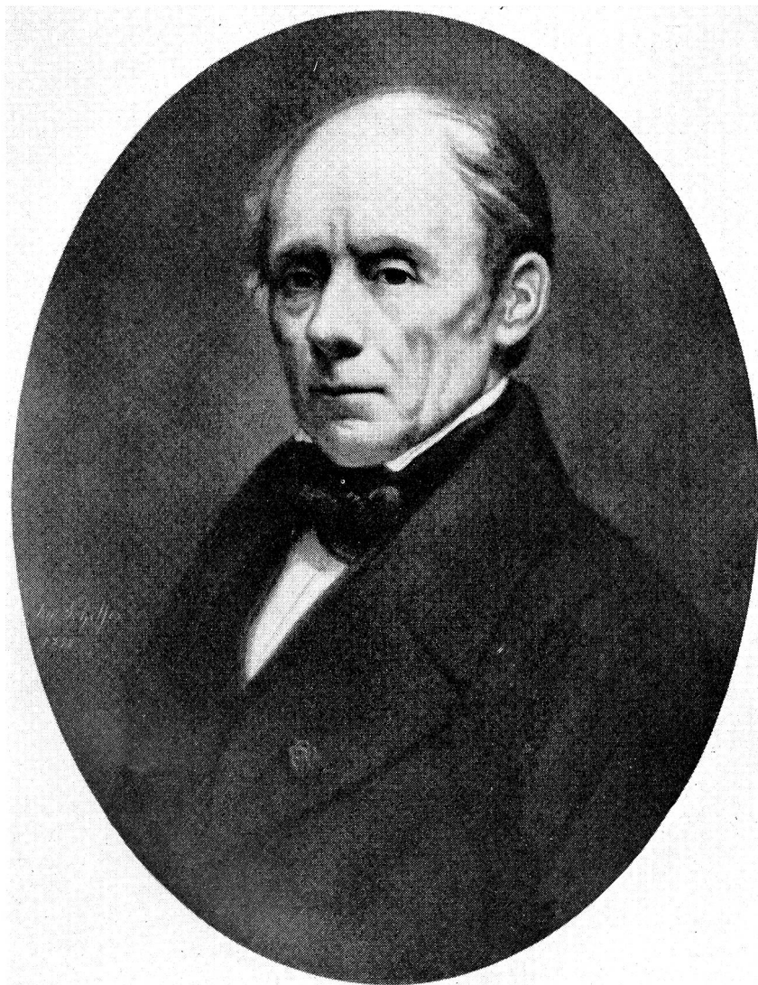
Le général G.-H. Dufour (1787-1875), commandant de l'armée suisse pendant la guerre du Sonderbund, président des délibérations qui amenèrent la conclusion de la Convention de Genève de 1864, président honoraire du Comité international

comme Florence Nightingale, comme Louis Appia, il est effaré de ce qu'il voit, des horreurs du champ de bataille, du manque de moyens d'hospitalisation, des blessés laissés, par force, sans soin durant des heures. Bon samaritain, il se multiplie, il fait tout ce qu'il peut dans la limite de ses moyens, il tente d'apporter quelque douceur aux malheureux souffrants; la fumée du tabac,