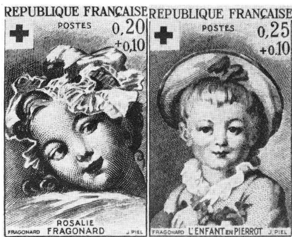
Les deux timbres de Noël 1962 de la Croix-Rouge française

Les timbres de Noël de la Croix-Rouge française seront mis en vente les 8 et 9 décembre à Angoulême, un bureau temporaire doté d'une oblitération « 1 er jour » sera ouvert à cette occasion à l'Hôtel de Ville. Les