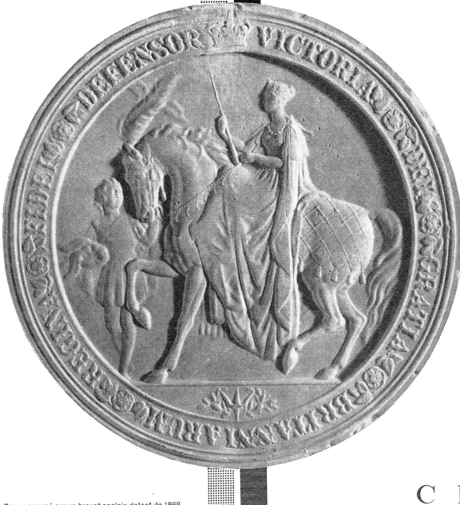
Sceau apposé sur un brevet anglais datant de 1868

Fidèle à une longue tradition, CIBA bâtit sa renommée sur les succès de la recherche scientifique dans les divers secteurs de son activité.