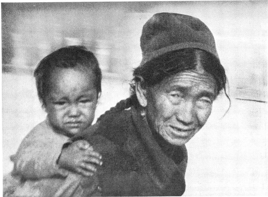
Enfant tibétain et sa mère. A droite, le premier avion de la Croix-Rouge internationale, un Pilatus, a été piloté par le pilote suisse Hermann Schreiber sur la piste qui a été créée à son intention par des volontaires et des réfugiés à Mingbo dans le Khumbu, à 4700 mètres d'altitude.