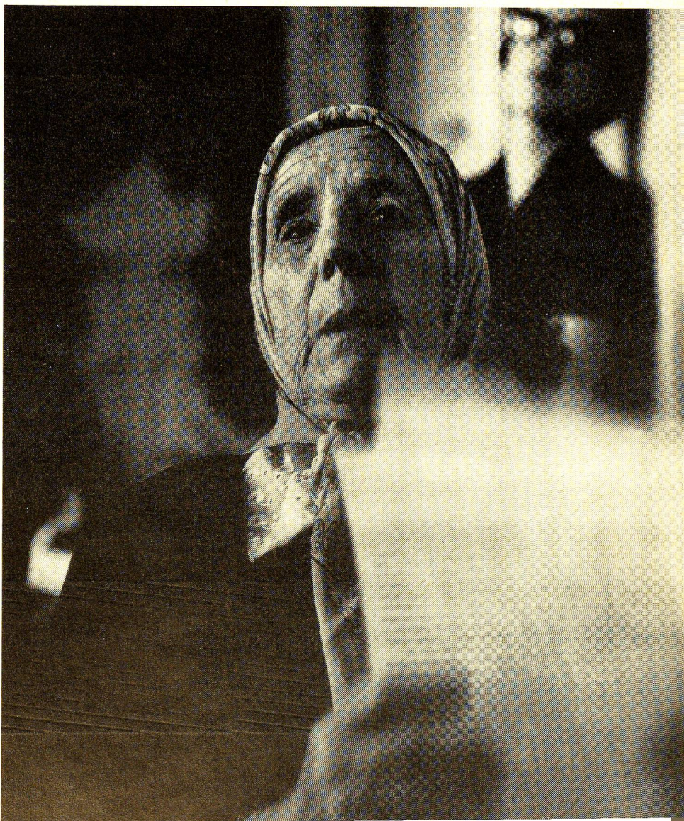
Le visage pathétique d'une réfugiée qui a trouvé asile en Suisse.