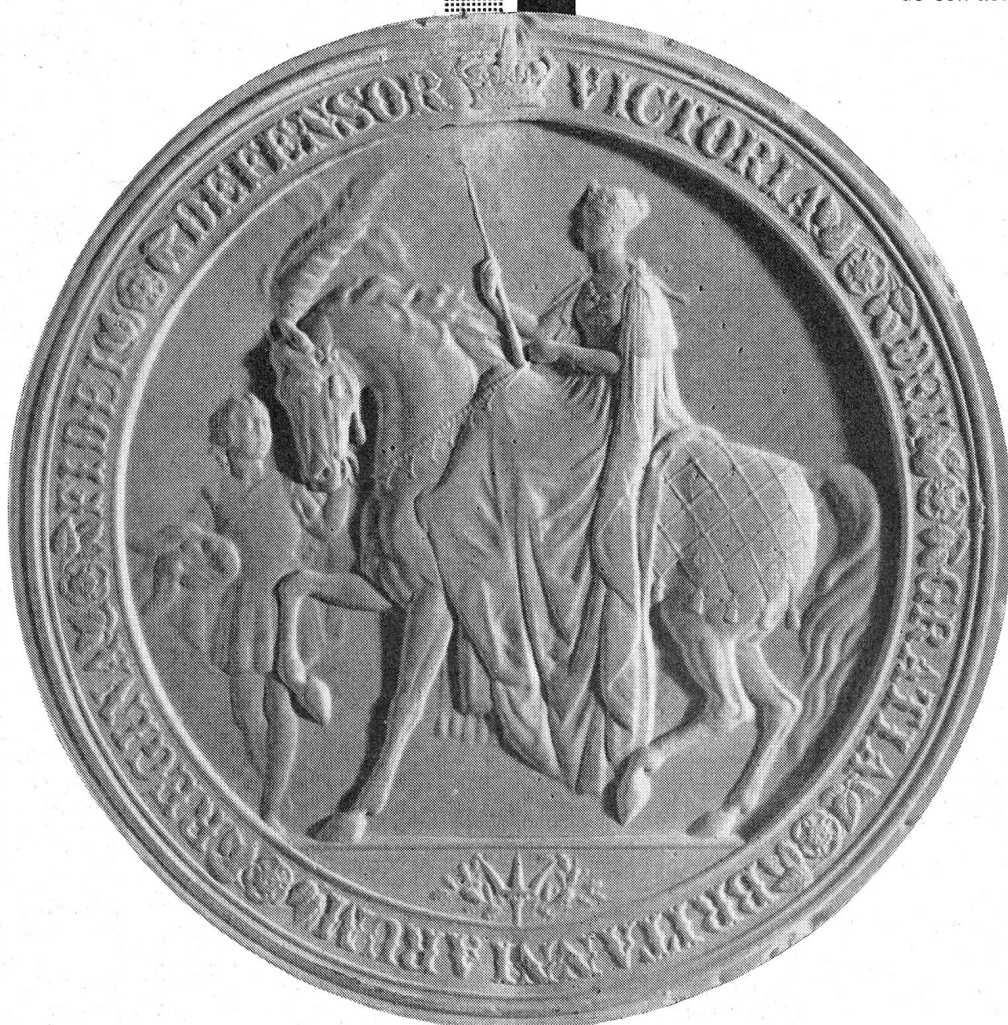
Sceau apposé sur un brevet anglais datant de 1868

Fidèle à une longue tradition, CIBA bâtit sa renommée sur les succès de la recherche scientifique dans les divers secteurs de son activité.