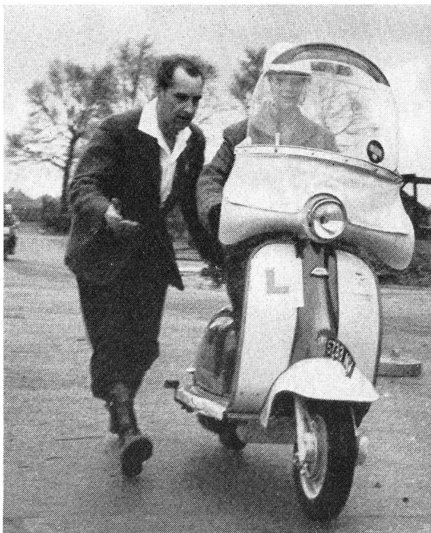
En Grande-Bretagne, l'on a poussé très loin le souci de l'éducation préventive des accidents. Témoin cette photo prise à l'école de conducteurs de scouts de la R. A. C. à Wembley.

Nous savons tous, combien les histoires terrifiantes peuvent se graver profondément dans le cerveau d'un enfant, tout prêt