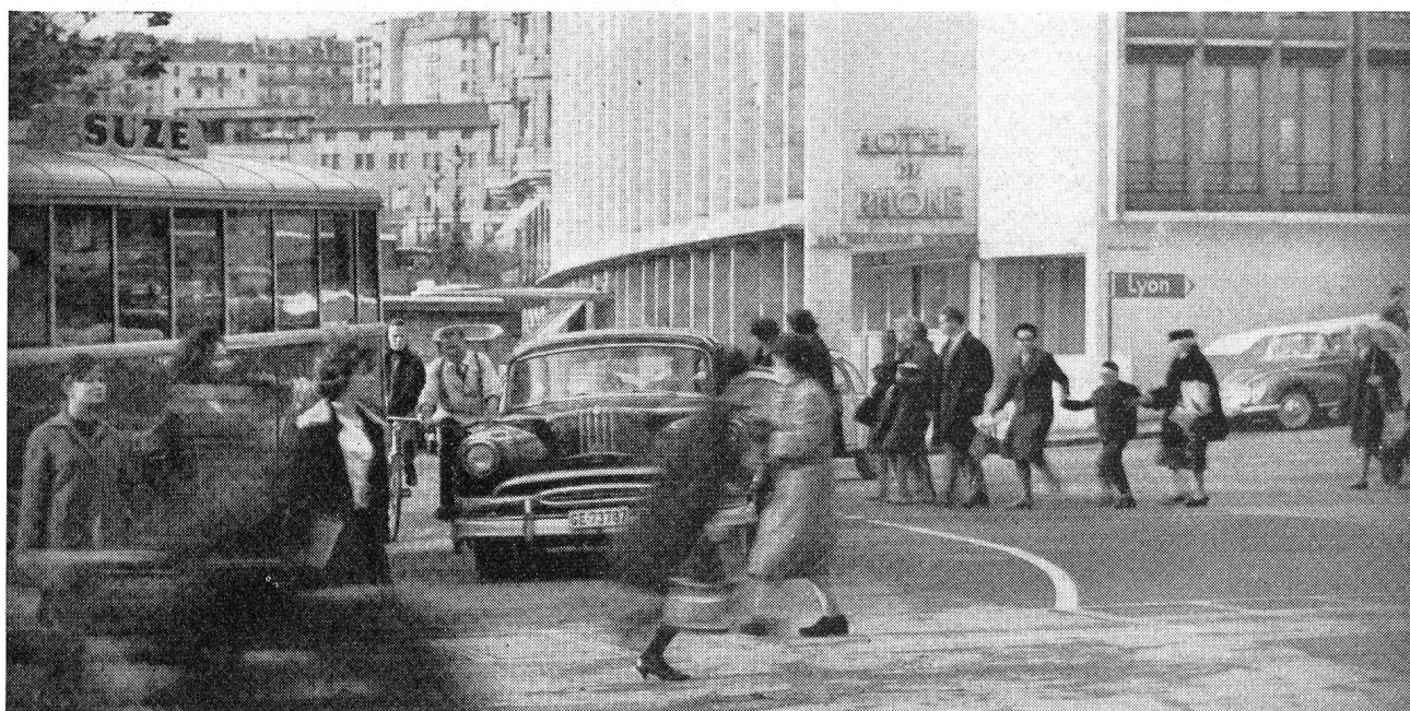
L'accident n'est pas accidentel... Il suffit pour s'en persuader de contempler l'ahurissante pétaudière causée par l'indiscipline commune des piétons, des cyclistes et des véhicules à moteur à un carrefour d'une de nos grandes villes romandes