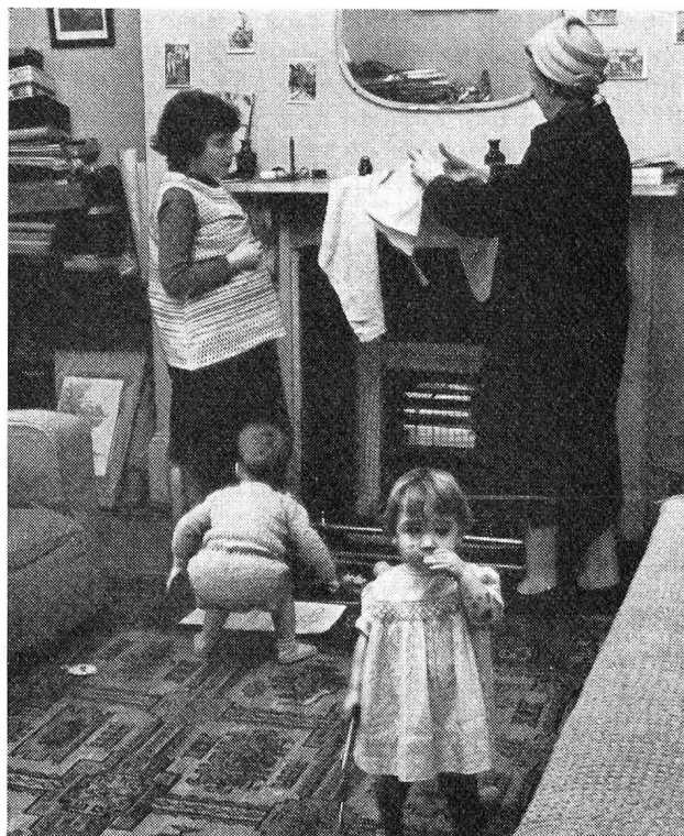
Les dangers domestiques. Une visiteuse d'hygiène, en Angleterre, montre à la mère le danger de mettre sécher des linges à proximité d'une cheminée

N'y aurait-il pas dans ce domaine un travail qui pourrait être également accompli discrètement par les