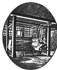
Exposition Nationale Berne 1914 Médaille d'or (collective)

Fabrication de toiles bernoises faites à la main et à la machine, tissus en pur lin, mi-fils et en coton.