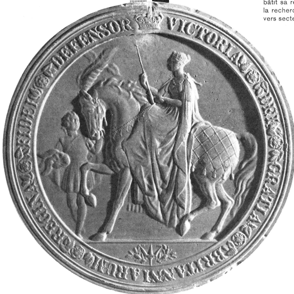
Sceau apposé sur un brevet anglais datant de 1868

Fidèle à une longue tradition, CIBA bâtit sa renommée sur les succès de la recherche scientifique dans les divers secteurs de son activité.