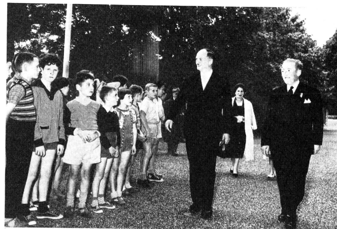
A Vaumarcus, le 1 er août, M. Chaudet, conseiller fédéral, est accueilli par les petits colons normands

sinière et son aide, deux jeunes filles, tous français, avec un étudiant hongrois de Neuchâtel, constituaient les cadres — tous avaient entre 17 et 22 ans et ils ont formé une équipe magnifique. Et, comme jamais encore on n'avait vu à Vaumarcus, de si bons et entreprenants marcheurs, des enfants jusqu'à leurs moniteurs, les excursions ont été nombreuses. Tour à tour les enfants ont exploré les villages environnants, les Roches du Mont-Aubert, le Creux-du-Van, la Ferme Robert et les gorges de l'Areuse — 8 h de marche pour les grands, les petits seuls ayant fait une part du trajet en chemin de fer. D'autres excursions les ont conduits à Chaumont et Valangin, à Morat en bateau, à Esta-