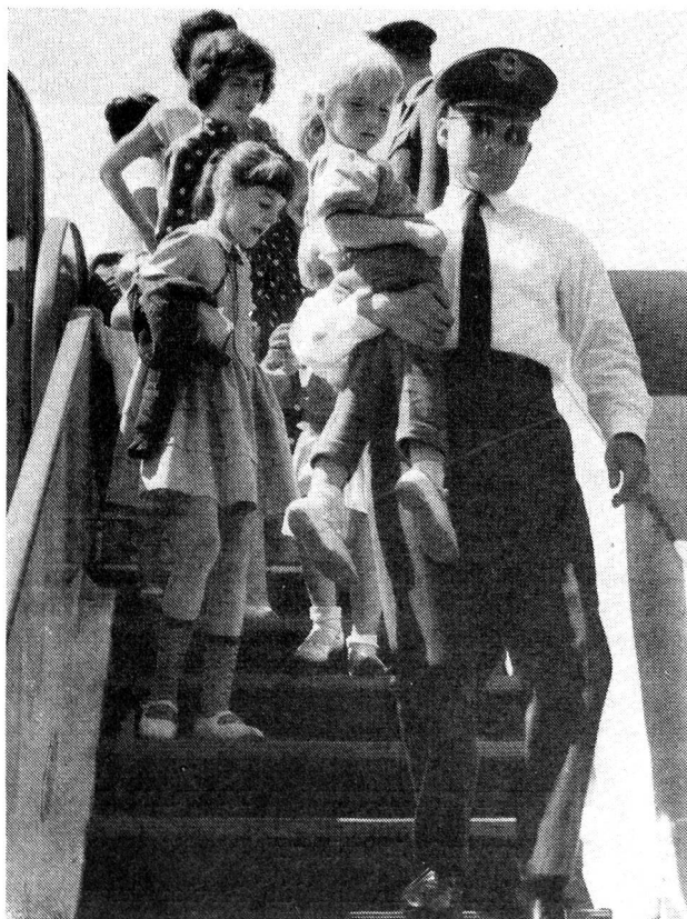
Arrivée à Cointin de l'avion rapatriant des Suisses du Congo

La Croix-Rouge de Belgique ayant demandé à la Ligue de se tenir prête à intervenir dans les territoires limitrophes au cas où une brusque détérioration de la situation provoquerait un exode massif de la population blanche en direction des divers pays frontières du Congo, les modalités de cette intervention furent immédiatement étudiées. Celle-ci pourrait consister en envoi non seulement de matériel de secours proprement dit, mais