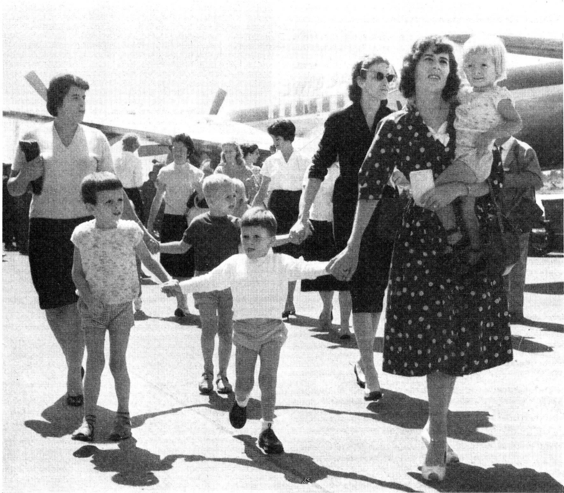
Des femmes et des enfants suisses rapatriés du Congo arrivent à Genève-Cointrin

A fin juillet, le Comité international poursuivait, dans différentes régions du Congo, sa tâche d'intermédiaire neutre afin de venir en aide aux victimes des