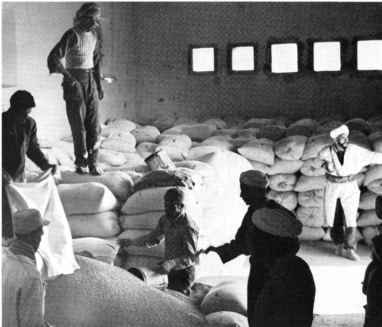
Au Maroc, en Tunisie, les sacs de vêtements vont être distribués aux réfugiés.