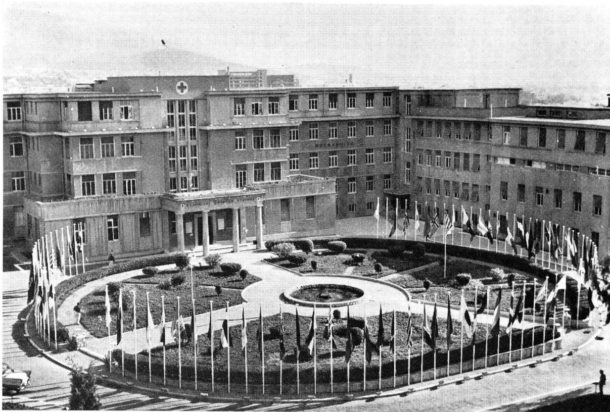
L'hôpital et l'école d'infirmières de la Croix-Rouge hellénique à Athènes où s'est tenue la XXV e session du Conseil des gouverneurs de la Ligue.