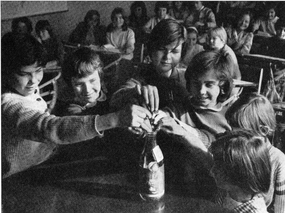
A l'école genevoise des Pervenches comme dans toutes les écoles romandes, des petits sous permettront d'envoyer du lait en Afrique du Nord.

D'excellents travaux ont été présentés, et il a été souvent difficile de déterminer entre plusieurs d'entre