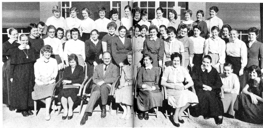
Le groupe des participants voyage « Henry Dunant ».