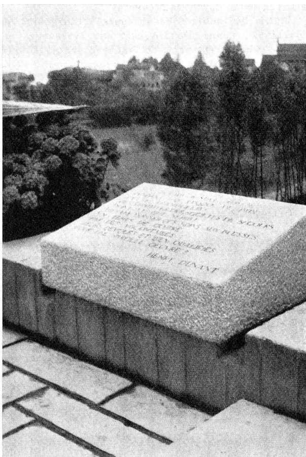
Sur un bloc de marbre, à l'entrée du monument, une phrase tirée du «Souvenir de Solferino» rappelle l'œuvre et le nom d'Henry Dunant.

« Malgré l'extension de notre mouvement, malgré le grand nombre de ses membres, malgré tout ce qui a déjà été accompli, il reste encore beaucoup à faire. Il y a beaucoup de misère,