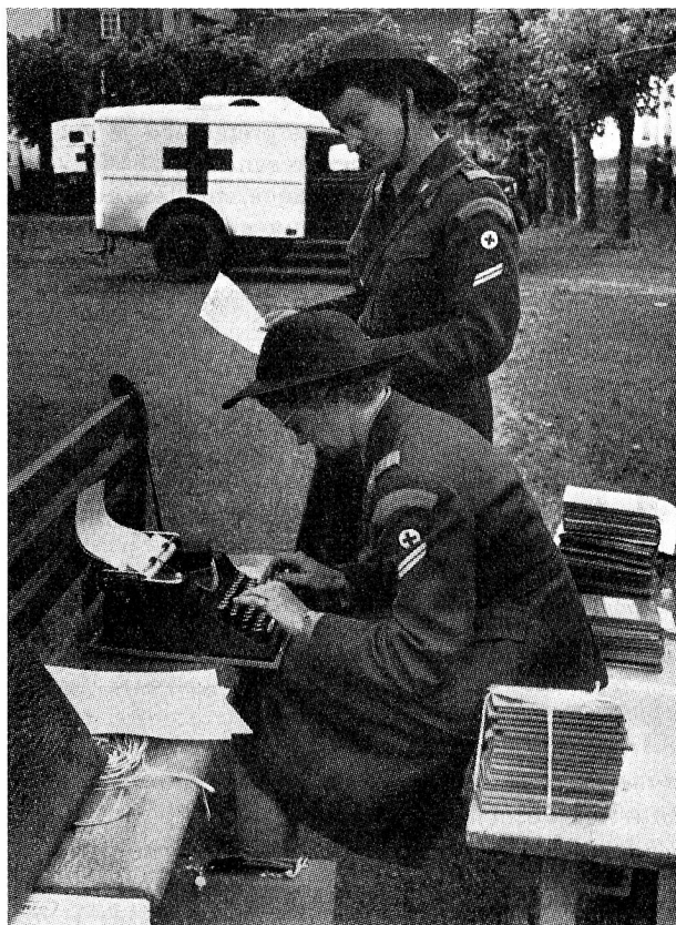
Deux chefs de détachement d'une formation croix-rouge inscrivent les résultats de l'examen radiologique dans les livrets de service.

D'autre part, la Croix-Rouge suisse doit s'adresser aux samaritaines , aux spécialistes et aux éclaireuses susceptibles d'entrer dans ses détachements pour leur faire comprendre la nécessité de se mettre dès à présent à disposition. Car les soins aux blessés et aux malades ne s'improvisent pas. Si l'on veut que nos malades et nos blessés, en cas d'urgence, puissent recevoir dans les formations appropriées les soins qu'ils appellent, c'est dès maintenant qu'il faut que ces détachements puissent être constitués et préparés à leur tâche. Lorsque survient une catastrophe, la Croix-Rouge suisse reçoit chaque fois une quantité d'offres de volontaires souhaitant se dévouer et venir en aide aux victimes, elle en reçoit même infiniment plus qu'elle n'en a besoin. Mais ces dévouements de la dernière heure, si touchants, si précieux soient-ils, ne peuvent remplacer auprès de malades ou de blessés le travail efficace et bien coordonné de formations composées de personnes préparées à cette tâche et à cette collaboration. Pour assurer la sécurité des nôtres, soldats ou civils, en cas de sinistre, de catastrophe, peut-être de guerre, nous devons être prêts dès maintenant. Il est donc indispensable que l'effectif nécessaire de spécialistes, de samaritaines et d'éclaireuses soit atteint dans nos détachements aussi rapidement que possible.