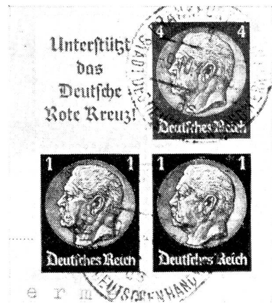
T. 1 et T. 2