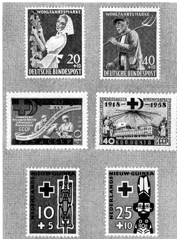
En haut: Allemagne, bienfaisance; au milieu: U. R. S. S., 40 e anniversaire des Croix- et Croissants-Rouges soviétiques; en bas: Nouvelle-Guinée néerlandaise.

Le Journal philatélique de Berne reproduit les nouvelles dispositions prises par les Postes turques le 9 juin 1958 pour les timbres à surtaxe émis notamment en faveur du Croissant-Rouge :