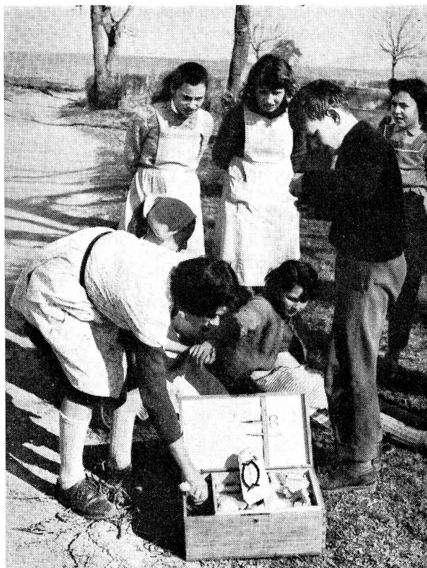
Les élèves apprennent à se servir d'une boîte de premiers secours.

Elle souligne aussi la portée pratique et durable de cet enseignement. Il rend service directement aux jeunes écoliers de 13 à 15 ans qui l'ont suivi, il rend service dans bien des cas à leurs familles. Il peut être également un heureux élément de propagande pour la protection civile. Il permet enfin à bien des milieux de se rendre compte du travail effectif de la Croix-Rouge, et ce n'est pas de moindre importance. Il faut souhaiter voir ce cours introduit dans beaucoup d'autres cantons. Dans l'intérêt public comme dans le nôtre propre.