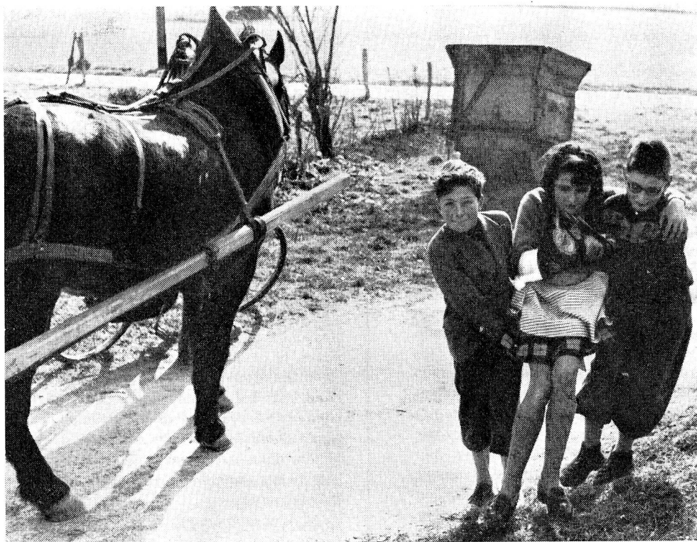
En plein air: les exercices pratiques, transport d'une «blessée».

Un contact s'est établi avec le Service médical des écoles où les infirmières scolaires s'intéressent à ce