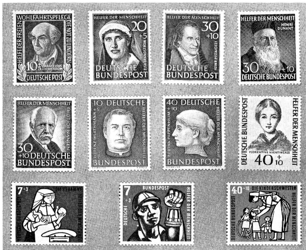
En haut: S. 2, S. 7, S. 8, S. 12; au milieu: S. 16, S. 18, S. 20, S. 24; en bas: S. 29, S. 25, S. 28.

Il convient donc de remplacer, pour la République fédérale allemande, au chapitre des timbres avec surtaxe au bénéfice de la Croix-Rouge, l'indication du timbre catalogué par nous S. 1 (Portrait d'Henri Dunant, 1952), par la liste suivante comprenant tous les timbres des émissions ci-dessus.