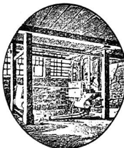
Exposition Nationale Berne 1914 Médaille d'or (collective)

Fabrication de toiles bernoises faites à la main et à la machine, tissus en pur lin, mi-fils et en coton.