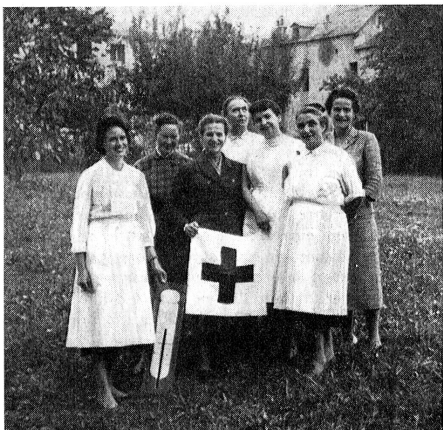
Les participantes du cours de Sion.