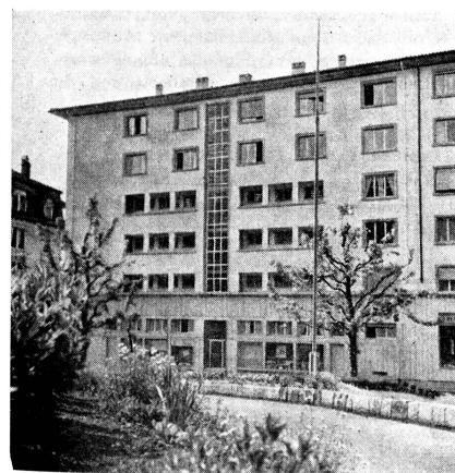
Le nouveau Foyer qui occupe les quatrième et cinquième étages du 31 de l'avenue Vinet.

Le 10 juillet, à l'hôpital de Sursee, vingt nouvelles recrues infirmières, samaritaines, spécialistes et éclair-