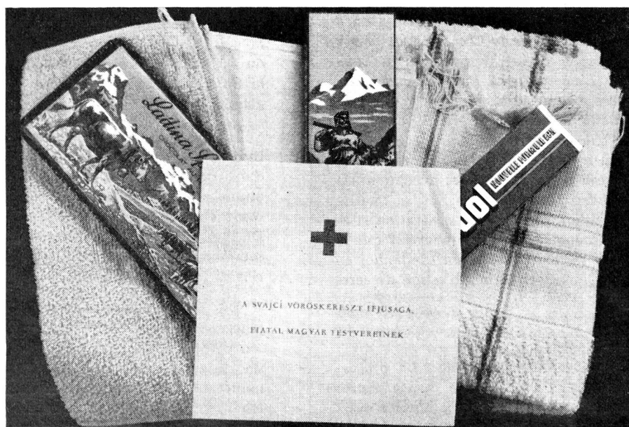
Un des 1400 sacs cadeaux offerts par les « juniors » suisses aux enfants de Budapest.

La Croix-Rouge néerlandaise a offert à la Croix-Rouge suisse, par l'intermédiaire de la Ligue des sociétés de la Croix-Rouge, 8000 exemplaires d'un petit dictionnaire en huit langues destiné aux réfugiés hongrois vivant dans notre pays. Il peut être obtenu aux adresses suivantes, gratuitement: Entraide ouvrière, Quellenstrasse 31, Zurich 5; Caritas-Centrale, Löwenstrasse 3, Lucerne; Entraide protestante, Stampfenbachstrasse 121, Zurich; Office central d'aide aux réfugiés, Jenatschstrasse 6, Zurich; Croix-Rouge suisse, Taubenstrasse 8, Berne.