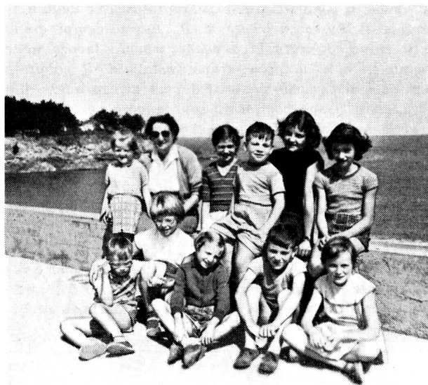
Un groupe d'enfants de Martigny à la colonie de vacances de Rotheneuf près de St-Malo.

Particolarmente interessante l'azione iniziata per raggruppare in una Federazione tutte le opere di assistenza sociale esistenti nel bellinzonese, azione partita