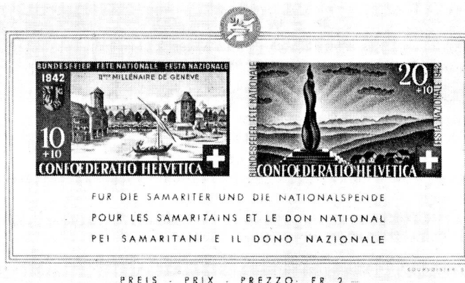
Bloc B. 1

intéressant les Sociétés auxiliaires de la Croix-Rouge suisse