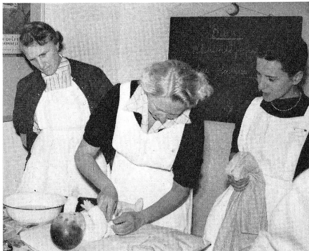
Servir: Cours de soins au foyer II, soins à la mère et à l'enfant.