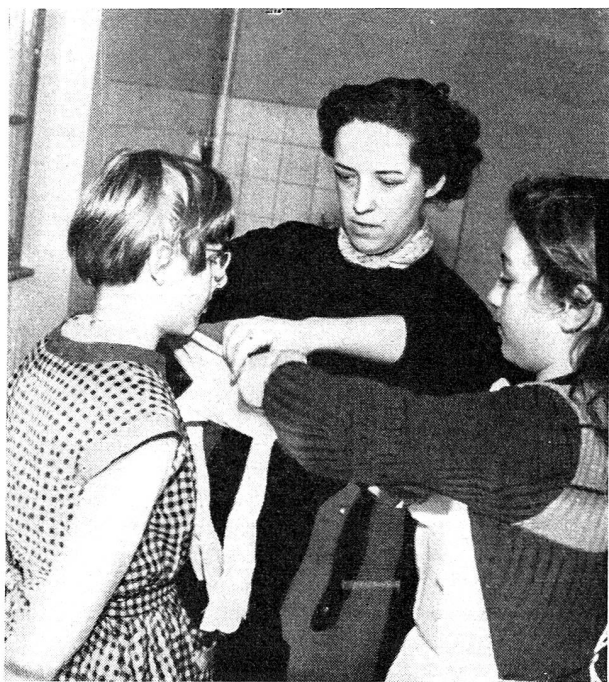
Servir: Juniors de la Croix-Rouge à un cours d'hygiène et de premiers soins.