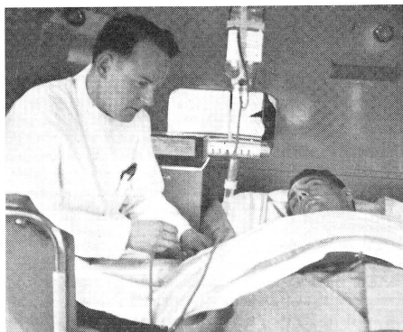
Servir: Transfusion d'urgence à un blessé.