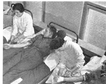
Servir: Prise de sang collective.

(«Revue internationale de la Croix-Rouge», février 1955.)